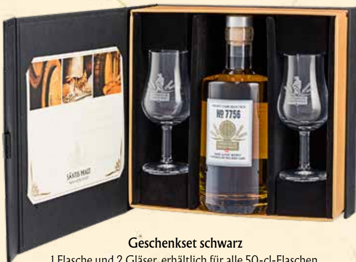
Geschenkset schwarz 1 Flasche und 2 Gläser, erhältlich für alle 50-cl-Flaschen. 50cl