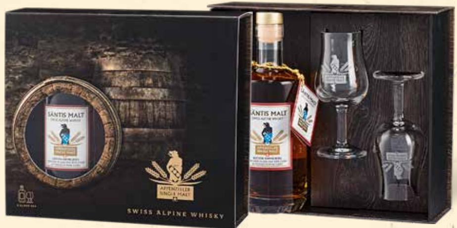
Nosing Set 1 Flasche und 2 Gläser, erhältlich für alle 50-cl-Flaschen. 50cl