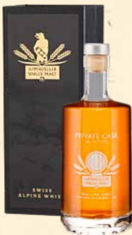
Geschenckpackung schwarz für 1 Privat Cask Edition 50cl

Die Natur schenkt uns natürliche Rohstoffe wie Wasser, Korn und Holz. Mehr brauchen wir nicht, um unseren Appenzeller Single Malt herzustellen. Ein unverfälschtes, natürliches Geschenk. Wir kleiden unseren Säntis Malt deshalb mit grosser Sorgfalt. Arrangieren ihn in edlen Sets, ergänzen ihn mit schönen Accessoires, geben ihm ein passendes Glas oder präsentieren ihn in schlichter Eleganz.