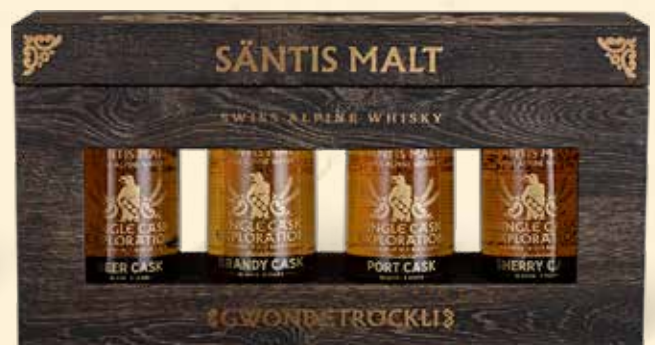
Säntis Malt Gwondetröckli 4x10cl Unser Gwondetröckli beinhaltet vier auserwählte Einzelfassabfüllungen aus verschiedenen Fasstypen. Diese zeigen, wie unterschiedlich sich der Einfluss verschiedener Holz- und Fasstypen auf den Whisky auswirkt.