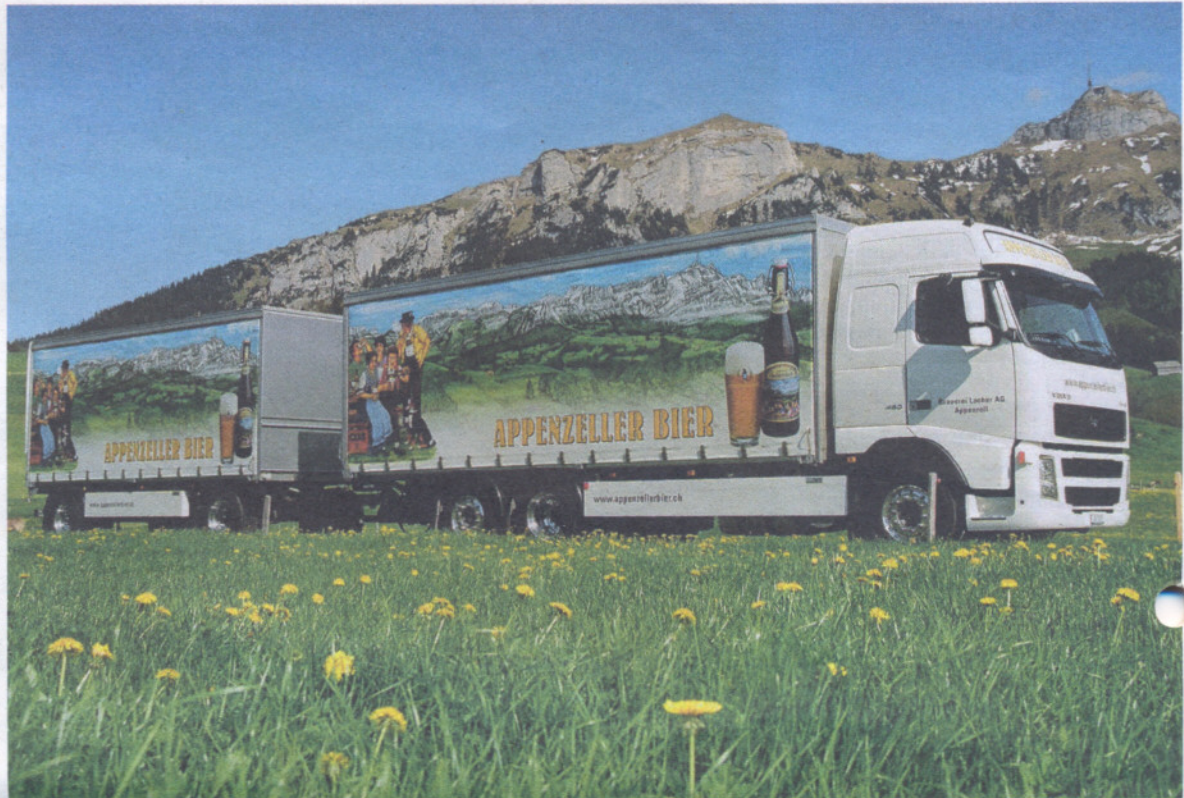
Das Appenzeller Bier ist mittlerweile in der ganzen Welt zu Hause.

Ganz klar ja. Die grossen Brauereien haben sich auf Industrie-Biere spe-