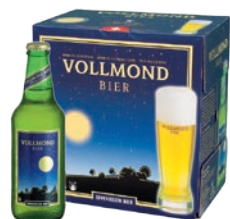
Vollmond Bier la birra misteriosa Biologica · bionda · Contenuto 33cl alc. 5,2% vol. · Conf. da 6 bott.