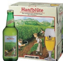
Hanfblüte la birra aromatica Birra alla canapa · Contenuto 33cl alc. 5,2% vol. · Conf. da 6 bott.