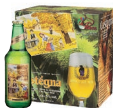
Castegna la birra pregiata Birra alle castagne · Contenuto 33cl alc. 5,0% vol. · Conf. da 6 bott.