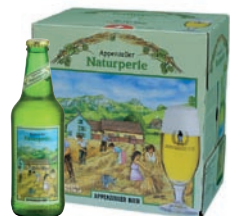
Naturperle la birra naturale Biologica · bionda · Contenuto 33cl alc. 5,0% vol. · Conf. da 6 bott.