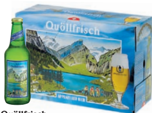
Quöllfrisch la birra delicata Lager · bionda · Contenuto 33cl alc. 4,8% vol. · Conf. da 10 bott.