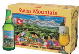
Swiss Mountain la birra ricca di tradizioni Premium lager · Contenuto 33cl alc. 4,8% vol. · Conf. da 10 bott.

Il nostro assortimento con vuoto a perdere, senza cauzione