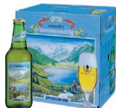
Sonnwendlig la cerveza del sabor lleno Sin alcohol · Contenido 33cl alc. 0,0% vol. · Conf. de 6 bot.