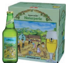
Naturperle la cerveza natural Biológica · Rubia · Contenido 33cl alc. 5,0% vol. · Conf. de 6 bot.