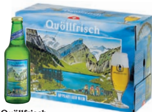
Quöllfrisch la cerveza suave Lager · Rubia · Contenido 33cl alc. 4,8% vol. · Conf. de 10 bot.