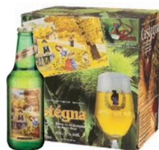
Castegna la cerveza preciosa Cerveza a las castañas · Contenido 33cl alc. 5,0% vol. · Conf. da 6 bot.