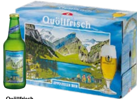
Quöllfrisch Lager · hell Einweg · ohne Depot Cont. 33 cl · alc. 4,8 % Vol.