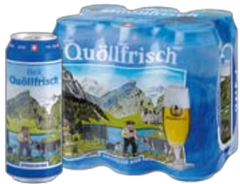
Quöllfrisch Lager · hell Einweg · ohne Depot Cont. 50 cl · alc. 4,8 % Vol.