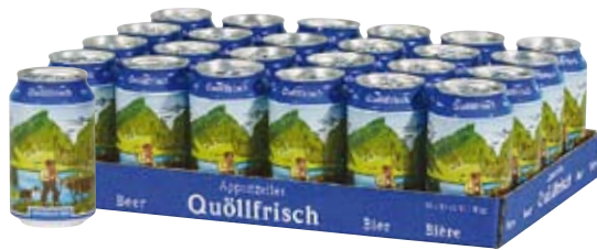
Quöllfrisch Lager · hell Einweg · ohne Depot Cont. 33 cl · alc. 4,8 % Vol.