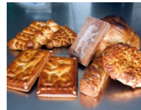
Die Bäckerei Motzer in Gonten ist neben dem Biber berühmt für Spezialitäten aus alten Zeiten: «Philet-Brot», «Chäsflade» und «Fünfpfünder».